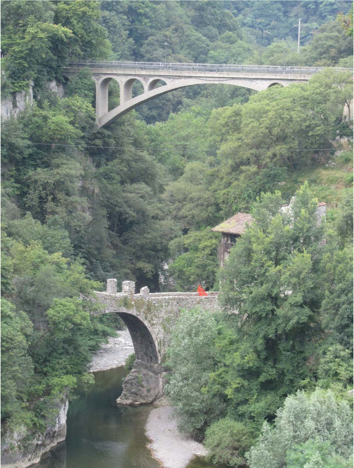
Ancien pont de Clanezzo (voir notre rubrique à ce sujet).