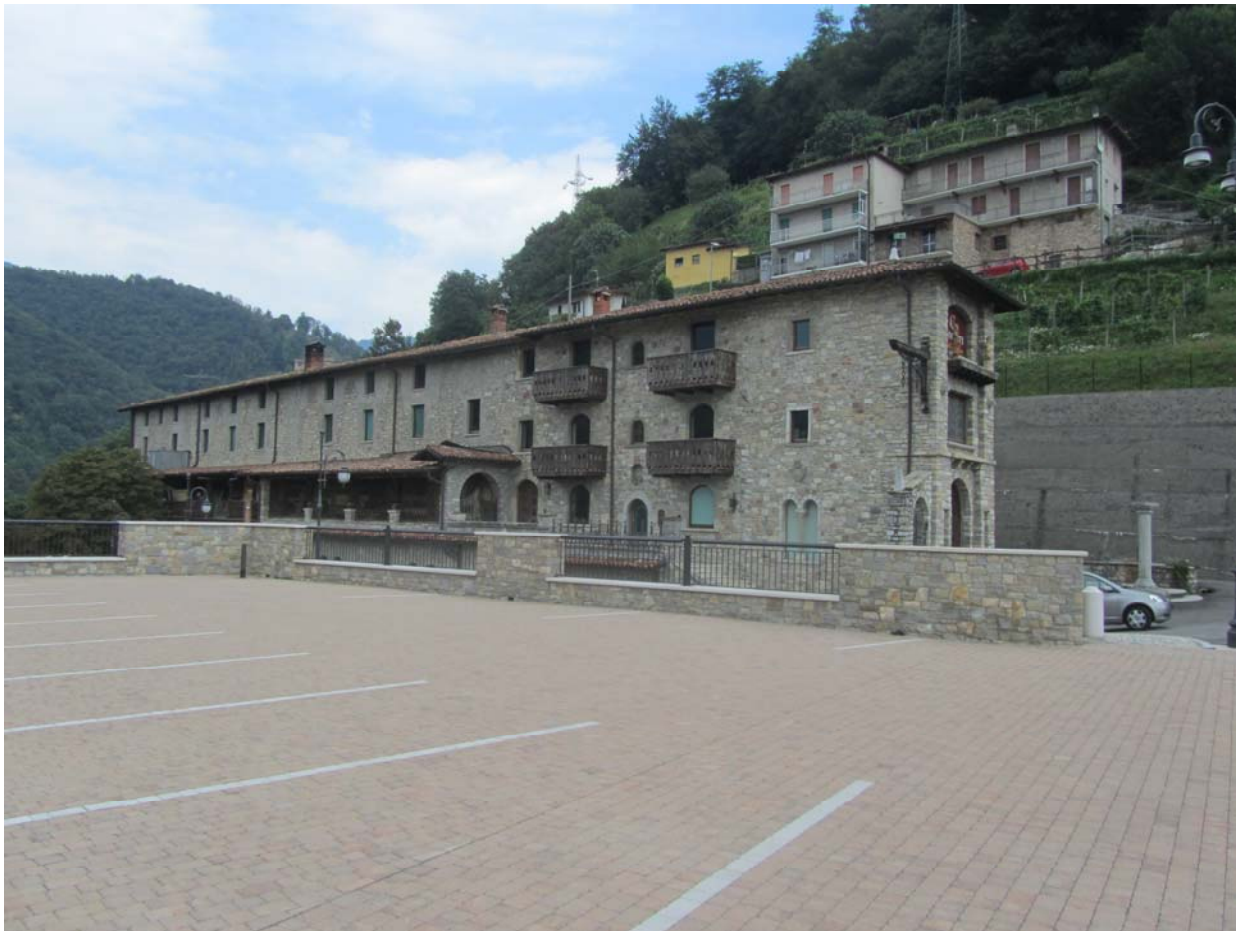
Le bâtiment vu de l'arrière. La route principale passe de l'autre côté.

Ce qui est beau, en somme, a toujours son prix !