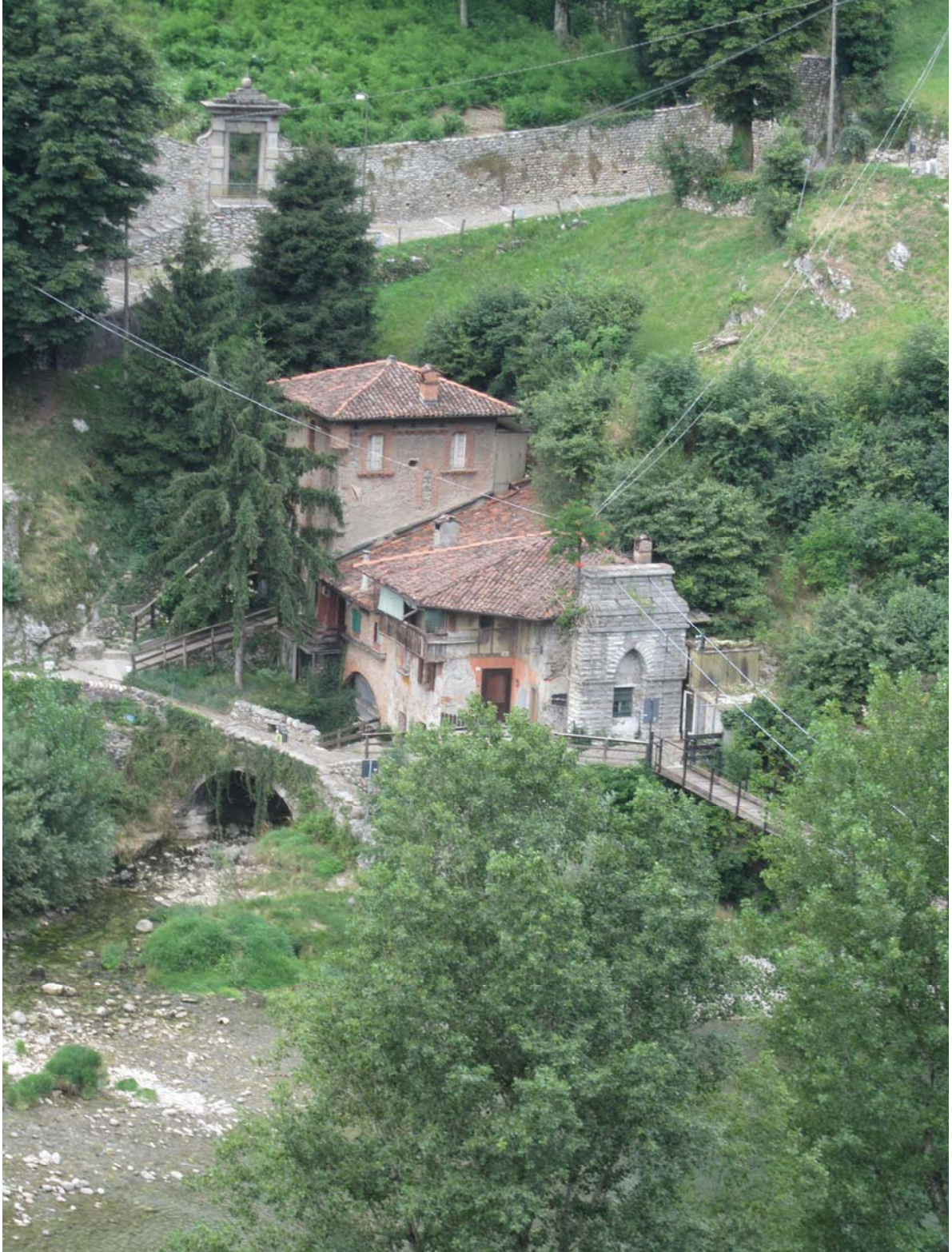
Tout au fond de la vallée, à proximité du pont de Clanezzo, les bâtiments du port. Dès ceux-ci un pont suspendu permet de traverser la rivière et de joindre la rive où nous nous trouvons.