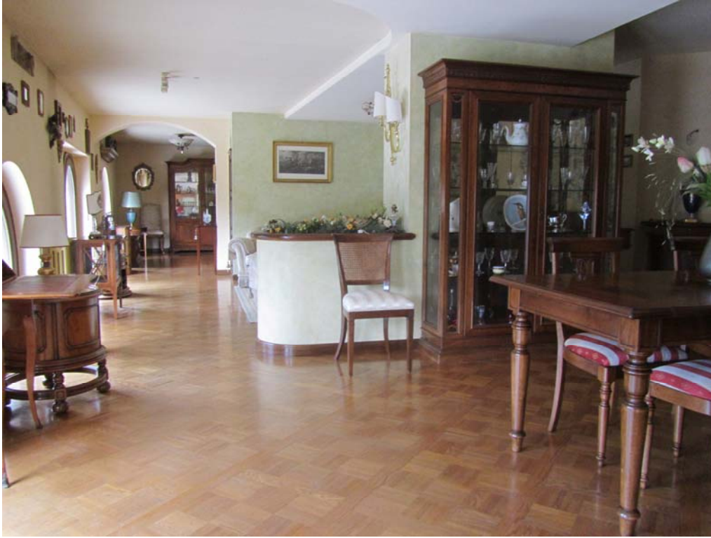
Des locaux qui ne manquent pas de charme.